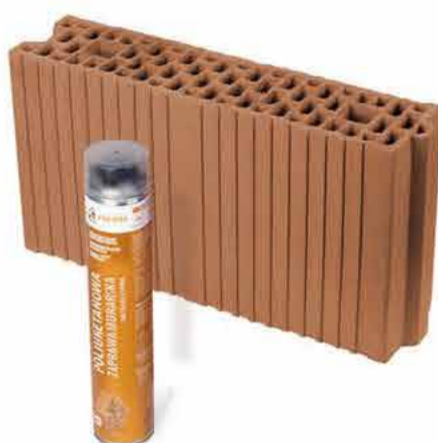
PRO-MAX 115/249 P+W