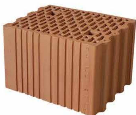
MEGA-MAX 250/238 P+W

pustaki do budowy ścian pustaki szlifowane pustak akustyczny