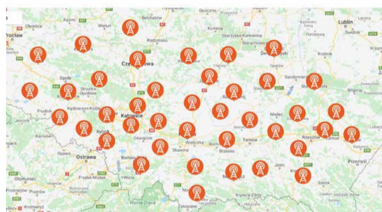
MAPA STACJI REFERENCYJNYCH

Równie ważnym elementem efektywnego kształcenia w zakresie geodezji, jest nasza, szkolna baza sprzętowa, która dzięki licznym projektom dofinansowanym przez Unię Europejską, prezentuje się nader okazale. Pracownia jest wyposażona przede wszystkim: w 4 odbiorniki satelitarne GNSS, 6 tachimetrów elektronicznych, 5 teodolitów elektronicznych, niwelator kodowy, 10 niwelatorów optycznych, ploter formatu A1 oraz liczny