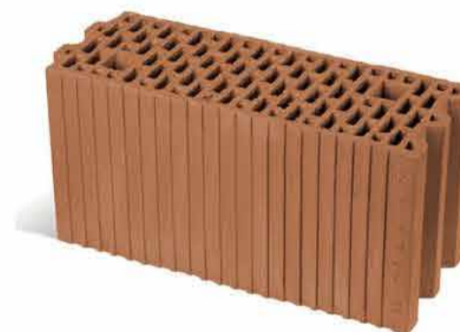
MEGA-MAX 188/238 P+W

W naszych pustakach jest coś więcej niż glina. Zawierają one całą naszą wiedzę, ogromne doświadczenie i zaangażowanie w to, by przekazać Państwu doskonałe jakościowo produkty.