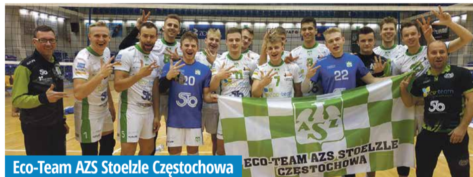
Eco-Team AZS Stoelzle Częstochowa