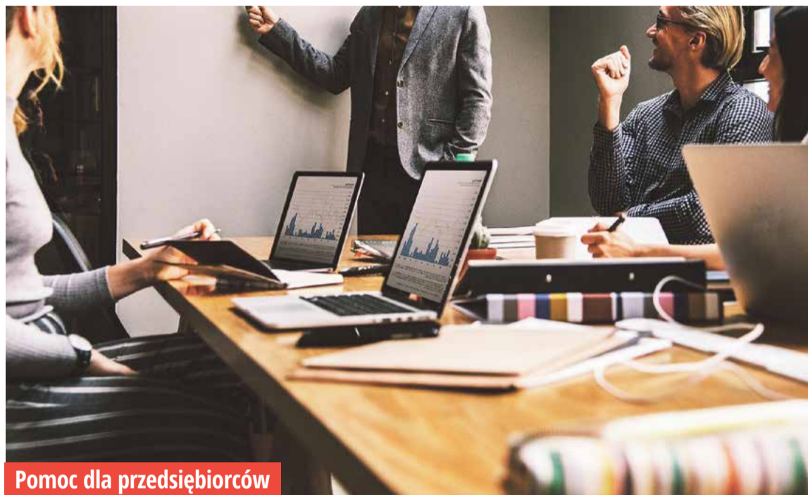
Pomoc dla przedsiębiorców

W 2018 roku w Częstochowie zaczęły pojawiać się zawiadomienia od mieszkańców w sprawie trucia ich czworonożnych przyjaciół. Wówczas smakołyki dla zwierząt faszerywane były trutką. Po dwóch latach, znów zaczynają pojawiać się niepokojące informacje. ■ s.5