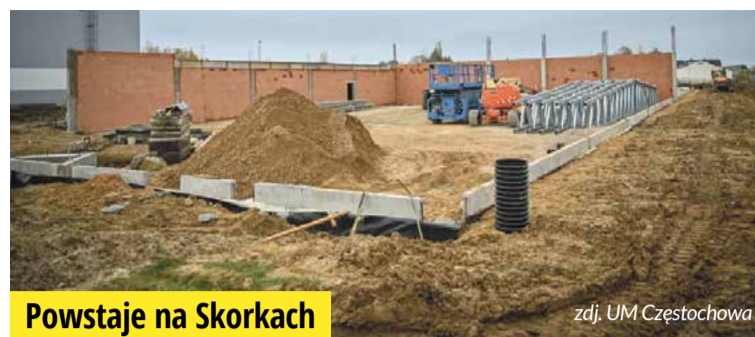
Powstaje na Skorkach