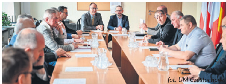
fol. UM Częstochowa

Częstochowska Rada Sportu obradowała w piątek 24 listopada w Urzędzie Miasta. Członkowie Rady zajęli się przede wszystkim sformułowaniem stanowiska wobec projektu miejskiego budżetu na kolejny rok - tych jego zapisów, które dotyczą kwestii sportowych.