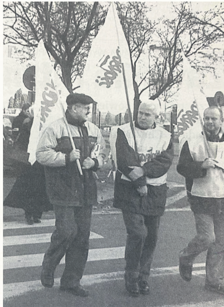
Pikieta nauczycieli związkowców przeszła przez centrum miasta

Spokojnym krokiem i w ciszy ruszyła wczoraj spod siedziby NOT-u przy ul. Kopernika kilkudziesięcioosobowa pikieta nauczycieli. Grupa protestujących związkowców przeszła pod siedzibę delegatury kuratorium oświaty, by wręczyć swoją petycję z postulatami jej szefowi Jarosławowi Grzybowskiemu. Potem samą petycję przekazano senatorowi SLD Grzegorzowi Lipowskiemu. Protest zakończył się na placu Biegańskiego. Na czele pikiety szedł przewodniczący Regionalnej Sekcji Oświaty i Wychowania NSZZ „Solidarność”