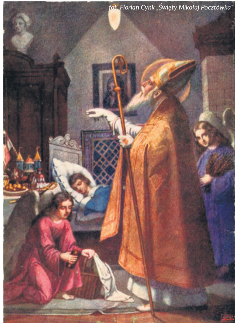
fot. Florian Cynk „Święty Mikołaj Pocztówka”

Choć obecnie wygląd św. Mikołaja wywodzi się z kultury masowej, jeszcze nie tak dawno dzieci odwiedzał nie mężczyzna w czerwonym stroju, z długą siwą brodą i w czapce z pomponem, lecz raczej ten, przypominający biskupa. Ubrany był w długą białą szatę z wyhaftowanym krzyżem, na głowie miał wysoką biskupią czapkę, a w ręku trzymał pasterkę laskę z zawieszonym dzwoneczkiem. Komercyjny św. Mikołaj jest raczej postacią łagodną i wesołą. Ten w wersji „biskupiej” wywoływał w dzieciach strach i kojarzony był z konserwatywną postawą i poważnym usposobieniem. W tej wersji św. Mikołaj nie