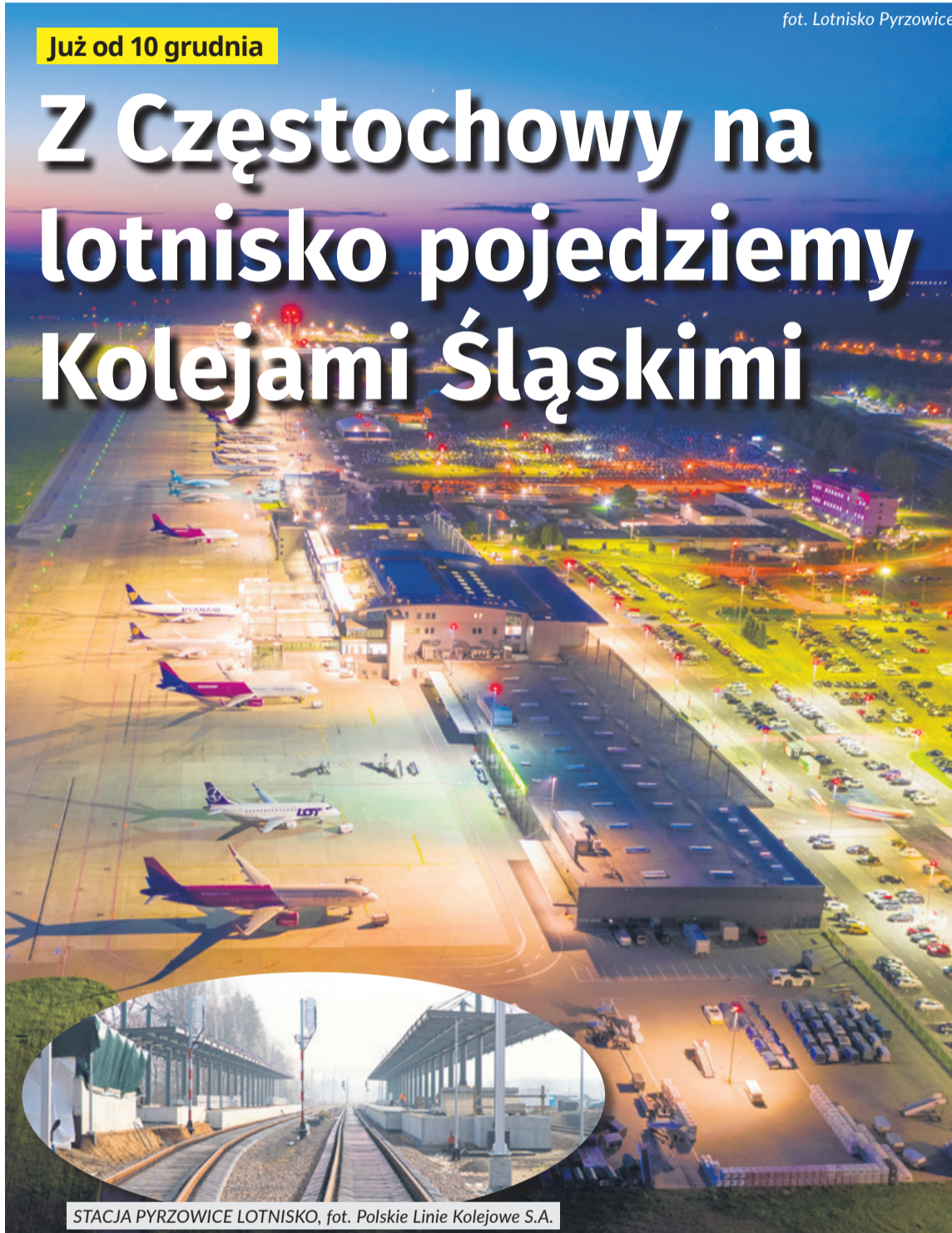
STACJA PYRZOWICE LOTNISKO

Już od 10 grudnia pasażerowie udający się na lotnisko w Pyrzowicach będą mogli pojechać na miejsce pociągiem. Koleje Śląskie uruchamiają bowiem nowe połączenie. Ma nie tylko ułatwić dotarcie do portu lotniczego, ale też zwiększyć potencjał samego lotniska, tłumaczył marszałek Jakub Chęstowski.