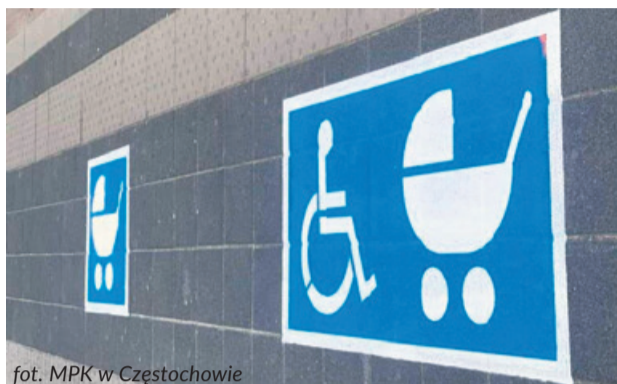
fol. MPK w Częstochowie

oraz wózek dziecięcy. Zostały wprowadzone pilotażowo, aby ułatwić wejście do tramwaju osobom z niepełnosprawnościami, a także rodzicom z wózkami dziecięcymi.