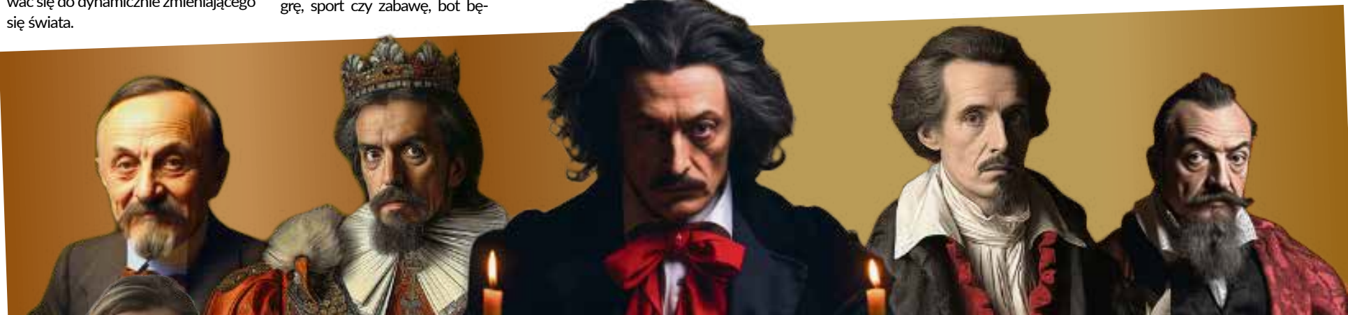
fol. Chatheroes Academy

MN: Tak, nie zapominamy o czynniku ludzkim. Pragniemy indywidualizować naukę w Chatheroes, dlatego każdy uczeń mający dostęp do naszej platformy, spotyka się raz w miesiącu z mentorem, aby omówić zadowolenie oraz postępy. Na podstawie wyników z zadań, quizów oraz egzaminów próbnych omawiamy wspólnie naukę na platformie, a dzięki tygodniowym powiadomieniom, wiadomościom i wyzwaniom zachęcamy uczniów do skutecznej nauki opartej o dyskusję oraz kontakt z naszymi bohaterami. Dążymy do tego, aby nasza platforma była przyjemniejszą, skuteczniejszą i tańszą alternatywą dla korepetycji.