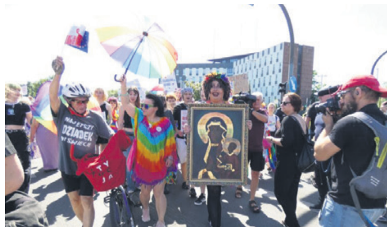
Marsz Równości w Częstochowie 2023 r.

Kampania Przeciw Homofobii poinformowała, że Prokurator Generalny Adam Bodnar wycofał skargę nadzwyczajną w sprawie dotyczącej obrazy uczuć religijnych podczas marszu równości w Częstochowie w 2019 roku, gdzie prezentowany był wizerunek Matki Boskiej Częstochowskiej z tęczą aureolą. O to apelowały liczne stowarzyszenia i organizacje, działające na rzecz wolności i osób LGBTQ+.