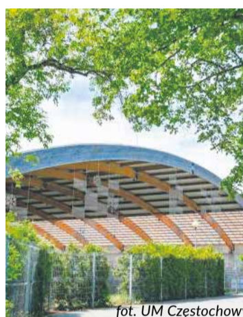
fol. UM Częstochowy

W ramach Budżetu Obywatelskiego sztuczne lodowisko w Częstochowie ma poszerzyć swoją funkcjonalność o rolnowisko. Miasto rozstrzyga właśnie przetarg na tę inwestycję.