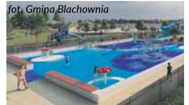
fol. Gmina Blachownia

pilnie zająć się kwestią kanalizacji deszczowej i budową separatora, który chroniłby nasz zalew przed ewentualnymi zanieczyszczeniami, które mogłyby trafić do lokalnych rzek i ostatecznie także do zalewu. W przyszłości ma to być bowiem kąpielisko, które będzie przyciągało nie tylko mieszkańców, ale również gości z innych gmin - wyjaśnił Burmistrz. Inwestycja obejmuje dwie kluczowe budowy, które zostaną zrealizowane na południowym i północnym brzegu zalewu. Z jednej strony powstanie Centrum Wystawiennicze, Muszla Koncertowa i Plac Zabaw. - Centrum wystawiennicze oraz muszla koncertowa zostaną dobudowane do budynku dawnego USC. Centrum wystawiennicze będzie miejscem, gdzie będziemy mogli bliżej poznać historię Blachowni, a muszla koncertowa stanie się nowym