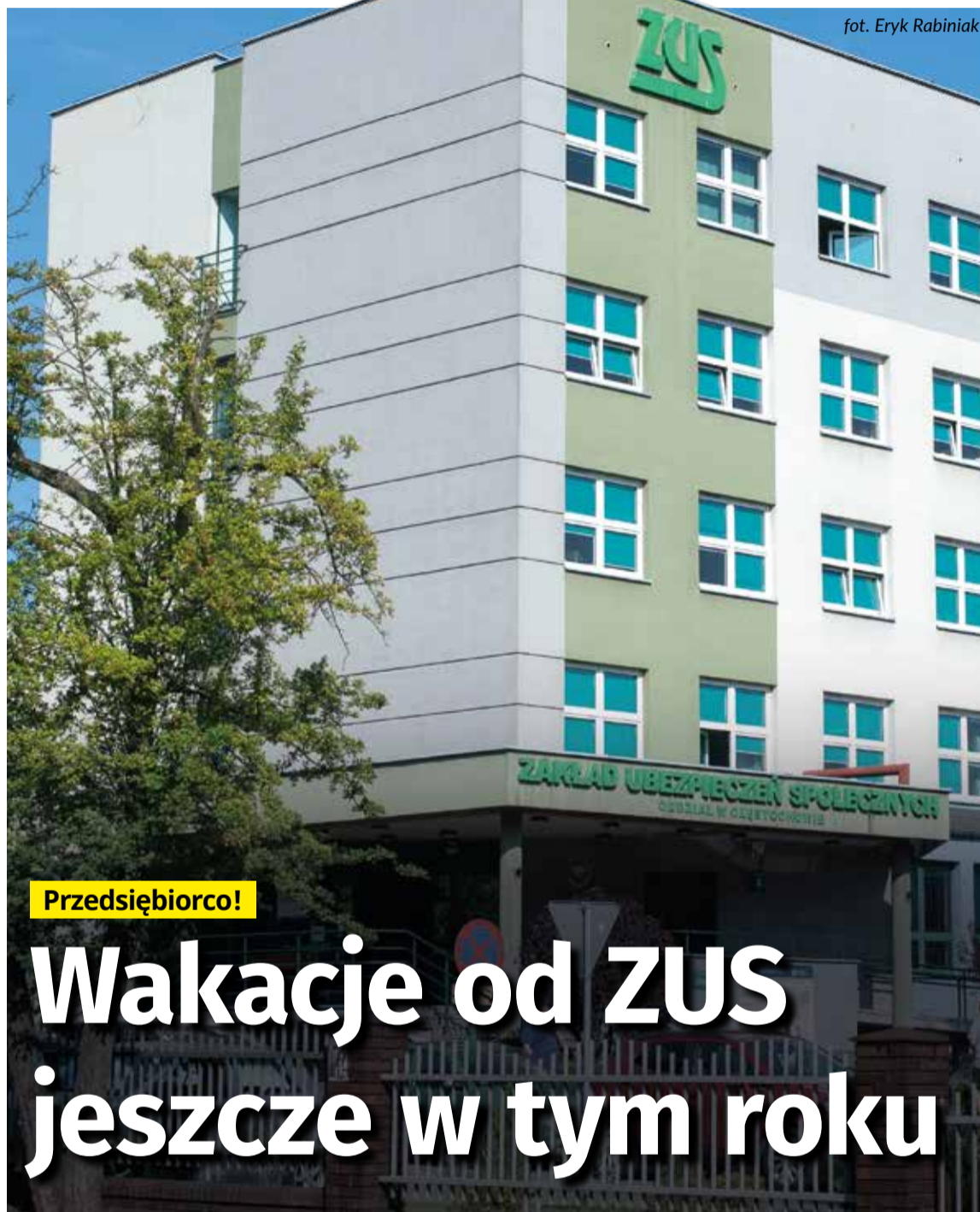
fol. Eryk Rabiniaak