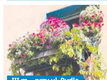
III m. - przy ul. Rydla