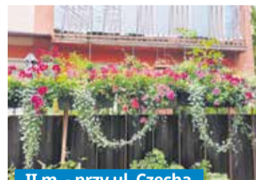
II m. - przy ul. Czecha