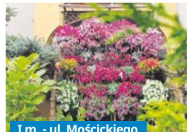
I m. - ul. Mościckiego