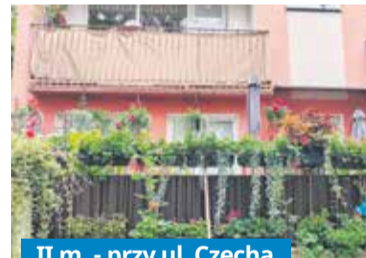
II m. - przy ul. Czecha